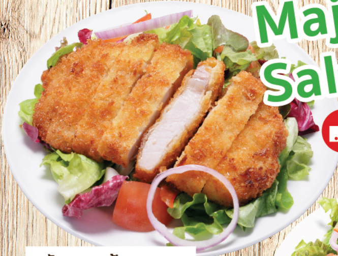
สลัดหมูขบแปงทอด Pork Cutlet Salad