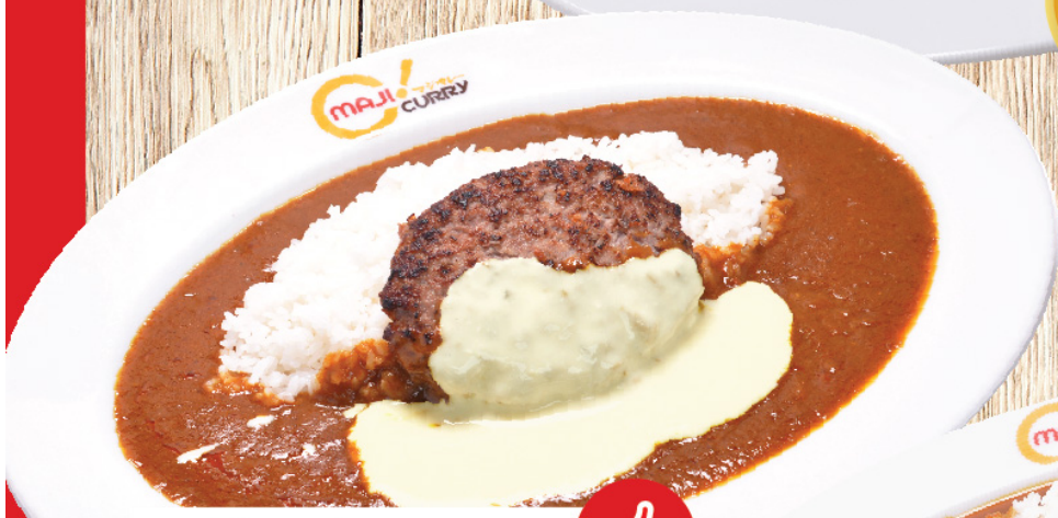
แฮมเบอร์เกอร์ราดซีส Hamburg Cheese Sauce Curry Rice ฟอนด์เยซุส掛けハンバーグカレー S 270B M 290B L 330B