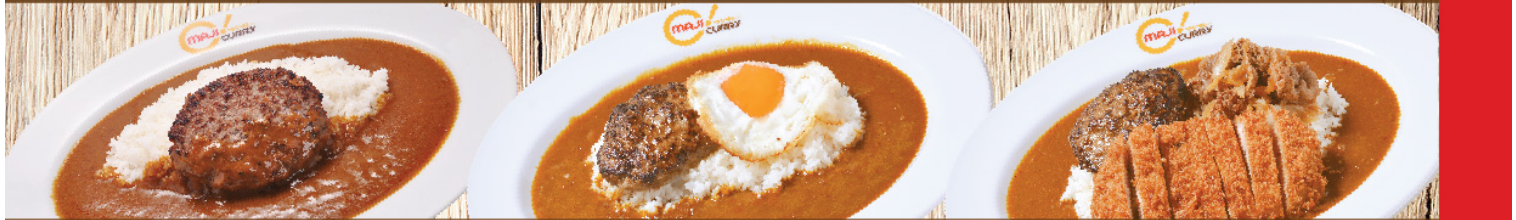
แฮมเบอร์เกอร์ Hamburg Curry Rice ハンバーグ แฮมเบอร์เกอร์ + ไข่ดาว Hamburg + Egg (Sunny Side Up) Curry Rice ハンバーグと目玉焼き เนื้อ 3 อย่าง Pork Cutlet + Hamburg + Boiled Beef Curry Rice ポークカツ・ハンバーグ・牛しゃぶ S 220B M 240B L 280B S 250B M 270B L 310B S 440B M 460B L 500B