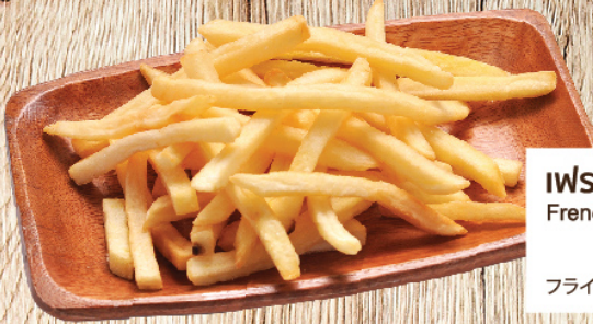
เฟรนช์ฟรายส์ French Fries