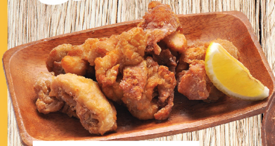
ไก่ทอดคาราอาเกะ Fried Chicken Karaage