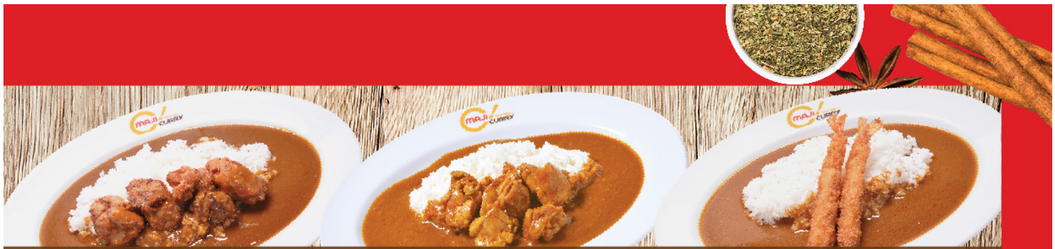
ไก่ทอด Fried Chicken Curry Rice から揚げ เนื้อไก่ Chicken Curry Rice チキン煮込み กุ้งชุบเกล็ดขนมปังทอด 2ตัว Fried Prawn(2pieces) Curry Rice エビフライ2本 S 190B M 210B L 250B S 190B M 210B L 250B S 190B M 210B L 250B