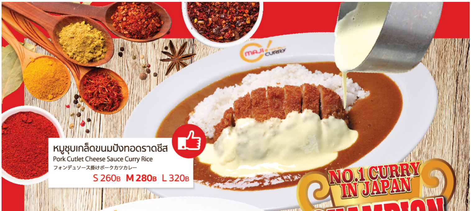
หมูชุบเกล็ดขนมปังทอดราดซีส Pork Cutlet Cheese Sauce Curry Rice ฟอนด์เยซุส掛けポークカツカレー S 260B M 280B L 320B