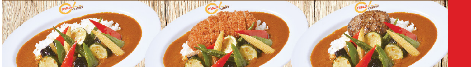
ผักรวม Vegetables Curry Rice 野菜 ผักรวม + กุ้งชุบเกล็ดขนมปังทอด Vegetables + Pork Cutlet Curry Rice 野菜とポークカツ ผักรวม + แฮมเบอร์เกอร์ Vegetables + Hamburg Curry Rice 野菜とハンバーグ S 200B M 220B L 260B S 280B M 300B L 340B S 290B M 310B L 350B