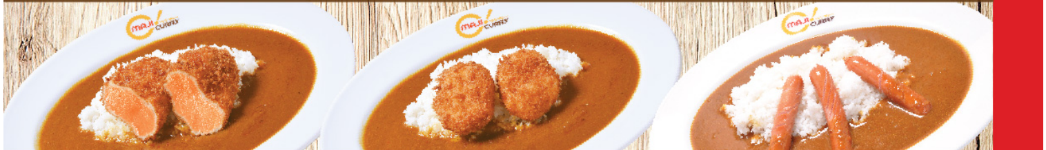
แซลมอนชุบเกล็ดขนมปังทอด Salmon Cutlet Curry Rice サーモンカツ ครีมโคร็อกเกะ 2อัน Cream Croquette(2pieces) Curry Rice クリームコロッケ2個 ไส้กรอก Sausage Curry Rice ソーセージ S 210B M 230B L 270B S 230B M 250B L 290B S 190B M 210B L 250B