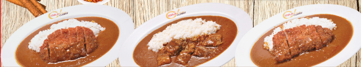
หมูชุบเกล็ดขนมปังทอด Pork Cutlet Curry Rice S 210B M 230B L 270B เนื้อวัว Beef Curry Rice S 210B M 230B L 270B ไก่ชุบเกล็ดขนมปังทอด Chicken Cutlet Curry Rice S 210B M 230B L 270B