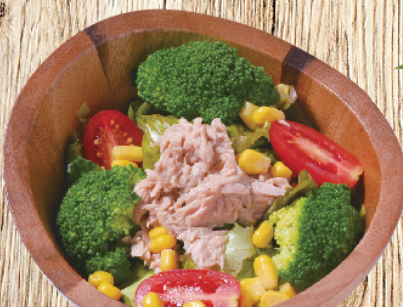
สลัดทูน่า Tuna Salad