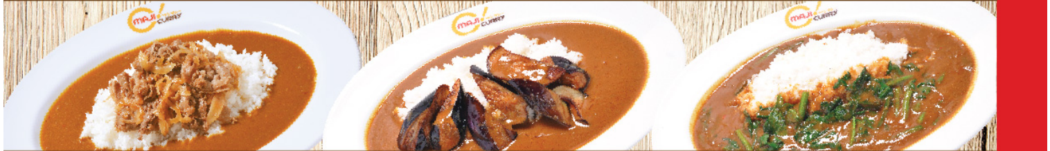
เนื้อชาบู Boiled Beef Curry Rice 牛しゃぶ มะเขือม่วง Eggplant Curry Rice ナス ผักโขม Spinach Curry Rice ほうれん草 S 270B M 290B L 330B S 170B M 190B L 230B S 170B M 190B L 230B