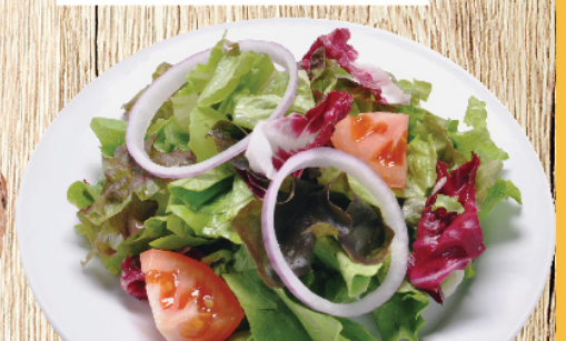
สลัด Green Salad