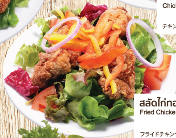
สลัดไก่ทอด Fried Chicken Salad