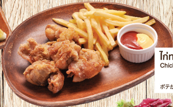
ไก่ทอด + เฟรนช์ฟรายส์ Chicken & Fries