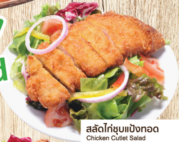
สลัดไก่ขบแปงทอด Chicken Cutlet Salad