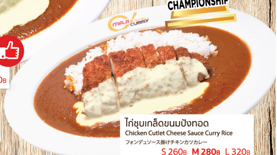
ไก่ชุบเกล็ดขนมปังทอด Chicken Cutlet Cheese Sauce Curry Rice ฟอนด์เยซุส掛けチキンカツカレー S 260B M 280B L 320B