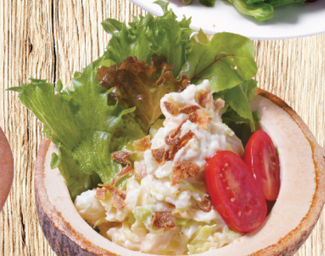
สลัดมันฝรั่ง Potato Coleslaw Salad